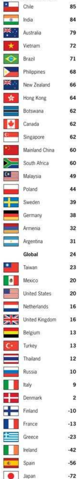
Abbildung 1: Optimismus-Pessimismus-Differenz [%; nächste 12 Monate]